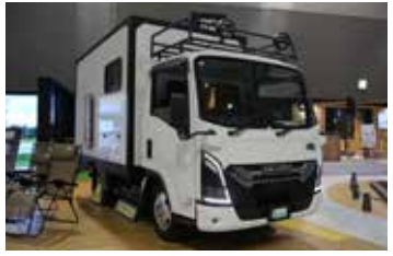
トラヴィオの兄弟分にあたるエルフベースのキャンピングカー専用シャシー「Be-Cam（ビーカム）」が架装されたキャンピングカーは「エクスぺディション・イーグル」

周りのドレスアップを行ない、トヨータイヤのトラヴィオ専用コンセプトタイヤを履くことでよりラグジッドなスタイルリングとなっています。 本誌 キャンピングカーとしての使用以外の需要はどうでしょうか？ いすゞ&NTB ここ近年の災害の発生状況から災害対策としての需要が増えてきています。個人のお客さんもそうですが、行政や企業からの引き合いもあります。また、工事現場での休憩場所や移動事務所などにも使われています。そういった用途に広がっていくことも視野に入れていまして、その意味ではAT限定普通免許で運転できるトラヴィオの可能性はまだまだたくさんあると思っています。