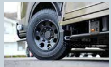
クロス・コンセプトに装着されたオープンカントリー・コンセプト

また、「トラヴィオ・ストライカー」には、「DELVE X M135TV」コンセプトタイヤを装着。快適な移動空間と個性を主張するリバーシブルサイドデザインがキャンピングカーの魅力を引き立てる。