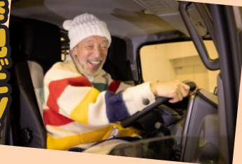
エルフミオは乗用車感覚の運転ができそう!