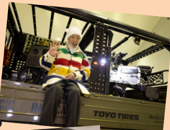
荷台はおとなの秘密基地。クロス・コンセプト、気に入りました!