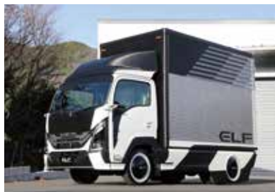
東京オートサロン 2024 に出品されたフューチャーアクセサリエディション

かにつながる形状のエアデフレクターなど、サイドは、デジタルサイドミラーを内蔵したコーナーパネルカバーやサイドアンダーパネルなどが特徴になります。リアは、スタイリッシュな一文字 LED テールランプを内蔵したりリアバンパーがエアロダイナミクスを訴求し、斬新なリアビューを演出しています。 本誌 実際に商品化された製品も採用されていますね。 A&S グリル周りのガーニッシュですね。1月にオートサロンに出品して1年足らずで商品化にこぎつける、そういったスピード感が用品の特徴ですので、新しいコンセプトカーを出品したら、来年、再来年には商品化していくといったサイクルで回していきたいと思っています。