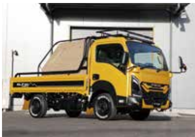
東京オートサロン 2024 に出品されたアウトドアエディション

かにつながる形状のエアデフレクターなど、サイドは、デジタルサイドミラーを内蔵したコーナーパネルカバーやサイドアンダーパネルなどが特徴になります。リアは、スタイリッシュな一文字 LED テールランプを内蔵したりリアバンパーがエアロダイナミクスを訴求し、斬新なリアビューを演出しています。 本誌 実際に商品化された製品も採用されていますね。 A&S グリル周りのガーニッシュですね。1月にオートサロンに出品して1年足らずで商品化にこぎつける、そういったスピード感が用品の特徴ですので、新しいコンセプトカーを出品したら、来年、再来年には商品化していくといったサイクルで回していきたいと思っています。