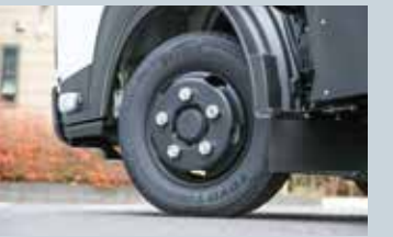
トラヴィオ・ストライカーに装着されたデルベックスM135TV