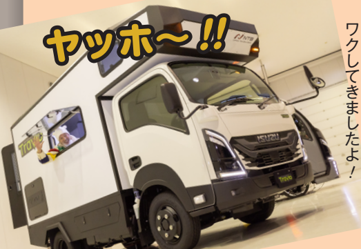
トラヴィオ・ストライカー、コイツにもワクワクです!

荷重の要件が厳しく、簡単にインチャップしたり偏平タイヤを履かせたりはできないと言います。でも、このホイールカバーならスタイリッシュでスポーティな足を演