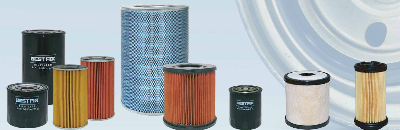
オイルフィルター